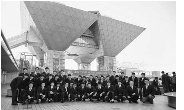
東京ビッグサイトで記念撮影

自動車科の生徒が、11月5日に東京ビッグサイトで開催されている第44回東京モーターショー2015を見学した。東京モーターショーは国内の自動車イベントでも最大規模で、今年は60周年記念としてシンガポールのパレードと展示も行われた。また、海外自動車メーカーの出展も多く、世界11カ国から合計160社が参加し、ワールドプレミア75台とジャパンプレミア68台を含む417台が展示された。生徒は熱心に見学し、疑問に感じたことは積極的に質問するなど、有意義な時間を過ごした。