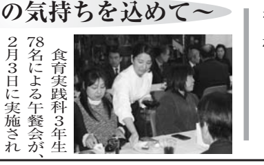
「思い出の料理」をテーマに生徒が主体となり、企画・立案し、会場の設営や料理の仕込みなど、短い期間中、協力して準備を行った。

「思い出の料理」をテーマに生徒が主体となり、企画・立案し、会場の設営や料理の仕込みなど、短い期間中、協力して準備を行った。当日は、3年間お世話