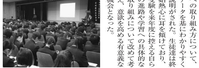
第2学年アルファコース、アドバンスコース選抜進学・特別進学クラス、食育実践科の生徒を対象とする進学講演会が、2月6日にベネッセホールで開催された。