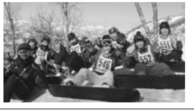
普通科の保健体育類型3年生のウィンタースポーツ実習が、1月31日から2月3日の3泊4日で福島県津田川スキー場にて実施された。

言葉を受け、生徒たちは、終始真剣に耳を傾けていた。その後の謝恩会では、3年間の思い出のスピーチが上映された。また、生徒からのサプライズ企画では、各クラスが日頃の感謝の気持ちを担任へ伝えた。生徒を代表して普通科7