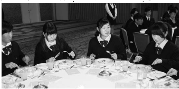
卒業を控えた3年生の生徒主催のテーブルマナー講習会兼謝恩会が、2月27日(土)ランドプリンホテル新館の宴会場にて行われた。