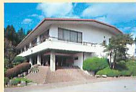
箱根アカデミー(神奈川県)