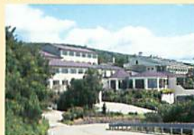
那須セミナーズクール(栃木県)