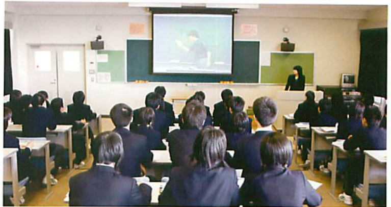
第1サテライン教室