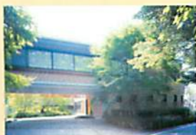
軽井沢セミナーハウス(長野県)