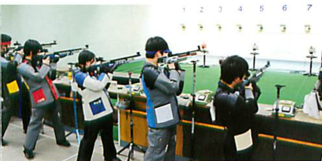
エア・ライフル場