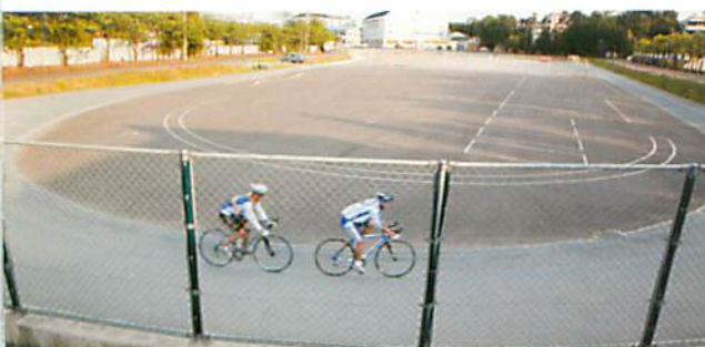
自転車専用バンク