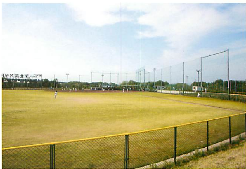
ベースボールスタジアム