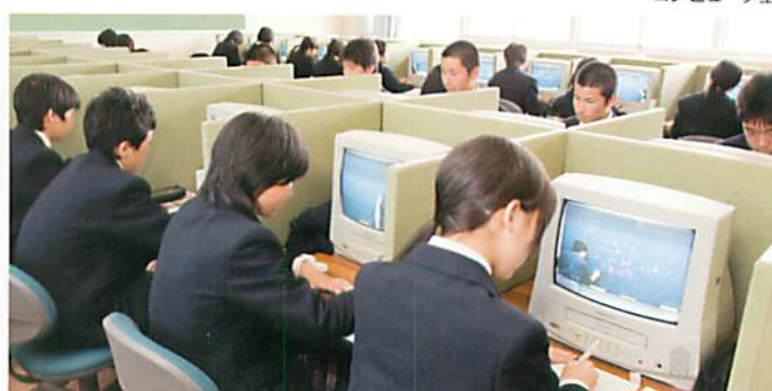
ビデオライブラリー室