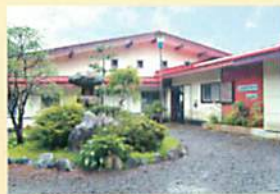
二本松セミナーハウス(福島県)