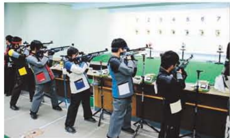
エア・ライフル場