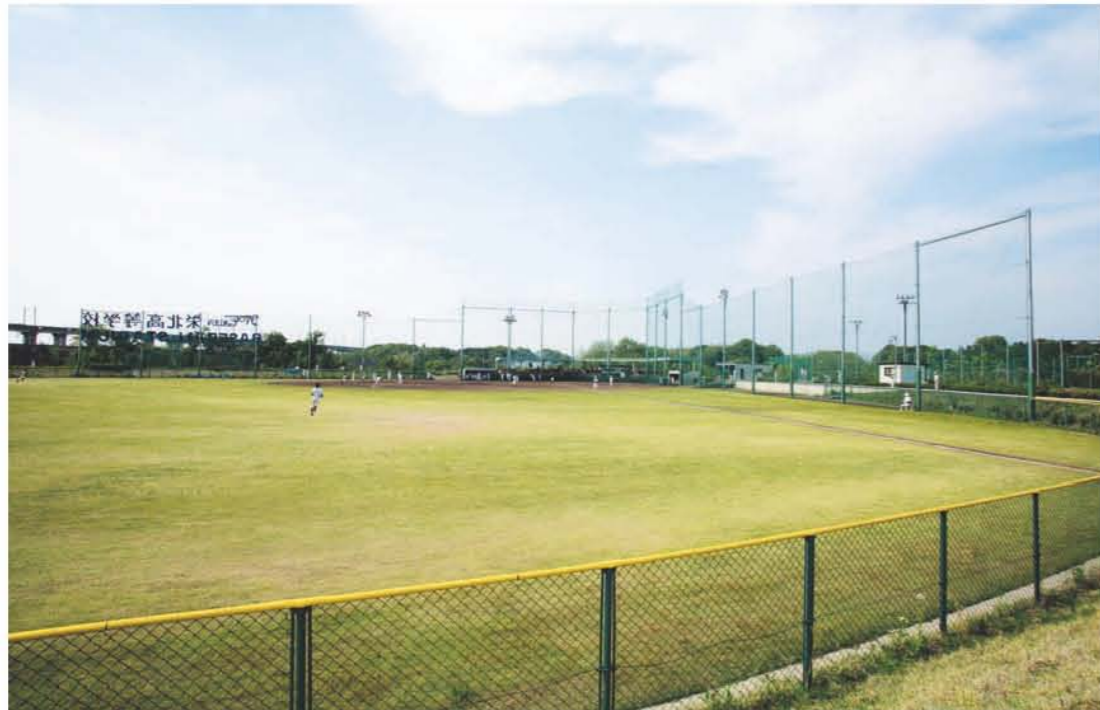
ベースボールスタジアム

天然芝のベースボールスタジアムや人工芝のテニスコート、そして心地よく使用できる室内施設。スポーツ施設にも細心の配慮を施して、使いやすさと機能性、安全性を追求し、クラブ活動をバックアップしています。文武両道を実践する栄北高校ならではの環境です。