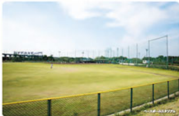
ベースボールスタジアム