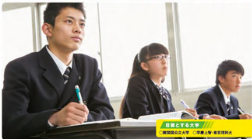
目標とする大学 ○難関国立大学 ○早慶上智・東京理科大学