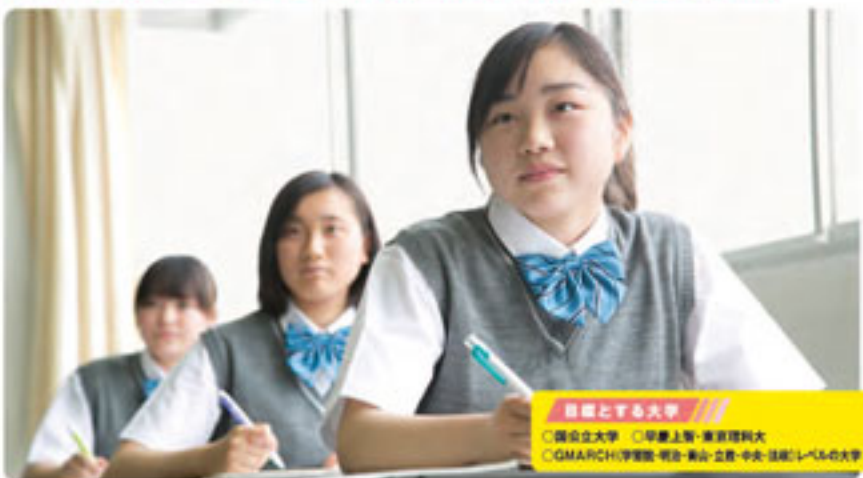
目標とする大学 ○国立立大学 ○早慶上智・東京理科大学 ○GMARCH・学習院・明治・青山・立教・中央・法政レベルの大学