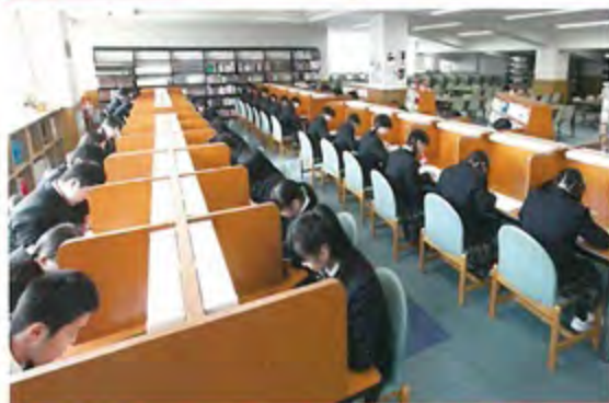
図書館 校風に合わせた個人ブースがあり、放課後や休み時間に生徒たちが利用しています。