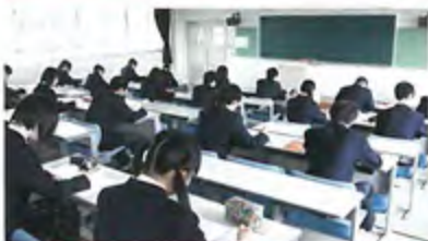
第1視聴覚室 100インチ大画面で講義を受けられます。

東北高校では、快適さがすみずみにまで行き届いた学習環境を用意、生徒が心地よく勉強やクラブ活動に励めるように気を配っています。生徒が自主的に学ぶためのSPルームも充実、設備面からも、生徒の成長をサポートしています。