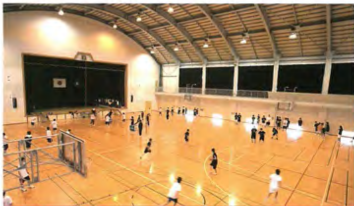
体育館 体育の授業の他、バスケットボール部やバレーボール部が使用しています。

天然芝のベースボールスタジアムや人工芝のテニスコート、そして心地よく使用できる室内施設。スポーツ施設にも細心の配慮を施して、使いやすさと機能性、安全性を追求し、クラブ活動をバックアップしています。文武両道を実践する東北高校ならではの環境です。