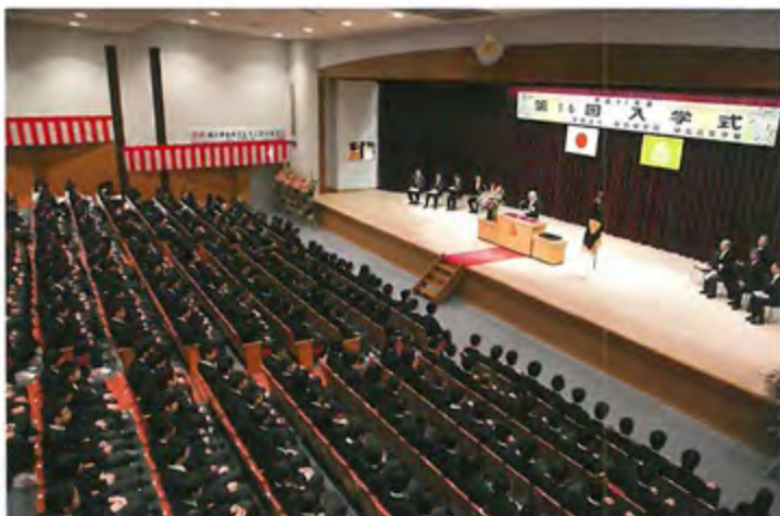
記念館ホール 入学式や卒業式、講演会などに使用される多目的ホール、852人も収容できます。