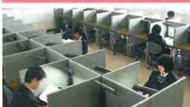
SPルーム 個別のブースで、放課後生徒たちが利用しています。