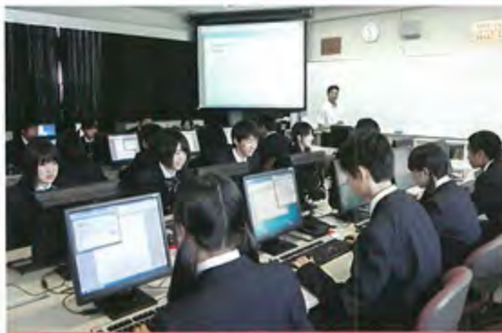
第1ITルーム 最新のコンピューター74台を完備しています。