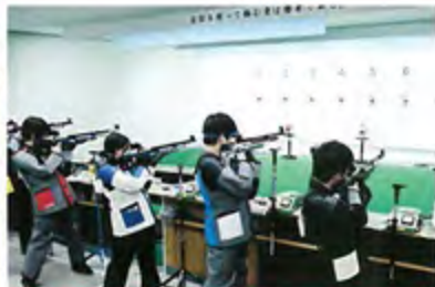
エア・ライフル場 エア・ライフル部が、ここでトレーニング。