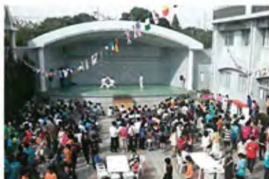
屋外ステージ 東北高等学校では毎年秋イベントステージとして利用。