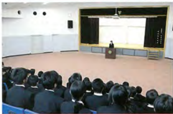
講義室 スライド式のプレゼン機、300人も収容できます。