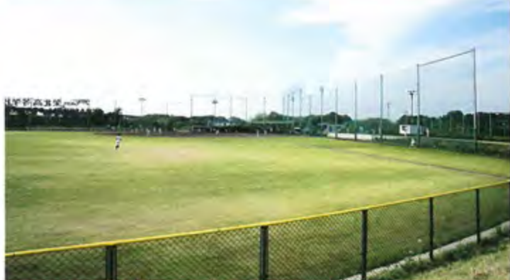
ベースボールスタジアム 両翼98m、センター122m、天然芝・照明付きの本格的な野球場です。