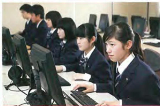
第2ITルーム インターネットを有効にした調べ学習も行われています。