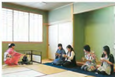
茶道室 茶道による茶会が実施されます。