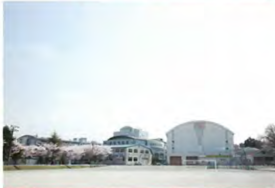
グラウンド 空が大きな広がるグラウンド、ナイター設備も整えています。