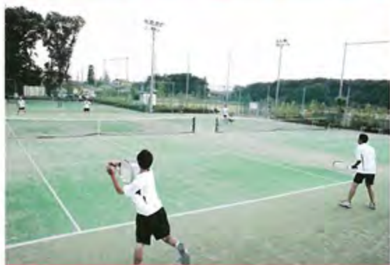
テニスコート 人工芝3面のテニスコート、照明付きです。