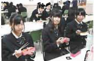
いっぱい食べて、午後の授業に備えます。