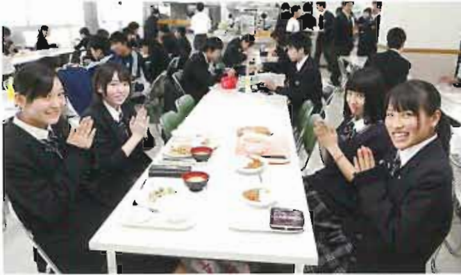
おいしさは、みんなを笑顔にします。

400人収容の食堂は、全学年が使用できます。 メニューは全部で30種類以上。 ランチタイムは多くの生徒が利用し、 楽しい食事のひとつを過ごしています。