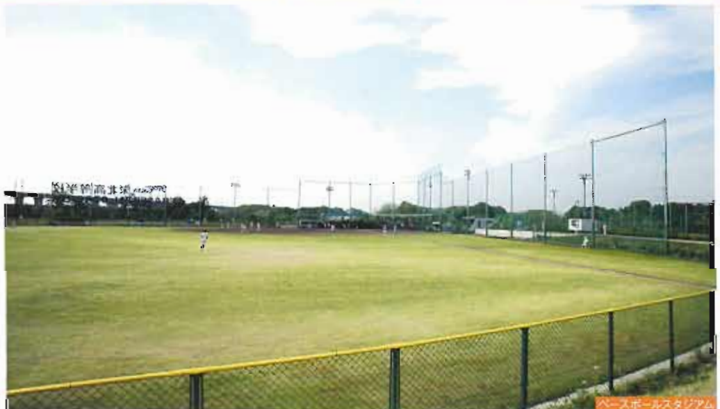
ベースボールスタジアム