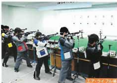
エア・ライフル場