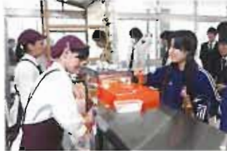
揚げパンやおにぎりなどのサイドメニューも。