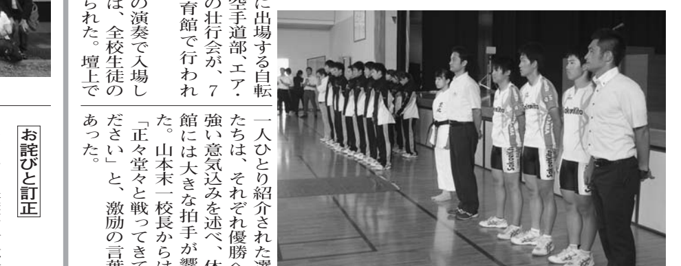
手前より、自転車競技部、空手道部、エア・ライフル部の面々

全国大会に出場する自転車競技部、空手道部、エア・ライフル部の壮行会が、7月21日に体育館で行われた。吹奏楽部の演奏で入場した選手たちは、全校生徒の拍手に迎えられた。壇上で一人ひとり紹介された選手たちは、それぞれ優勝への強い意気込みを述べ、体育館には大きな拍手が響いた。山本末一校長からは、「正々堂々と戦ってきてください」と、激励の言葉があった。