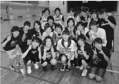
アトランタオリンピックで活躍した原田裕花氏(前列中央)と

女子バスケットボール部を対象に大塚製菓の企画である「ボカリスエット ブカツ応援キャラバン2015」が、6月5日に体育館で実施された。この企画は東京オリンピック開催を見据え、その主役になるであろう中学・高校生に向けた、著名アスリートによる指導や