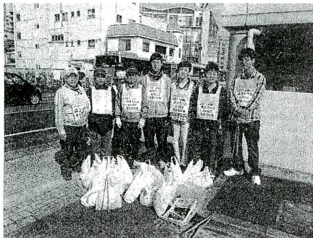
拾ったごみを前にパチリ

市民モラルの向上と啓発についての意見交換もあわせて行い、老人たちのグチも聞きながらの、貴重な活動でした。終わって学校名と名前を聞きましたが、栄北高校生で、上尾やさいたま市から交通費をかけてのボランティア活動で感謝いっぱいでした。