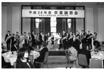
担任の先生方へ花束贈呈

と、それを取り巻く厳しい現実についての話があつた。また、就職後3年間で辞めていく人の多さについても説明がされた。その上で、大学入試を取り巻く環境や受験から卒業までにかかるおおよその費用、奨学金に関する解説が続いた。最後に、志望大学への進路